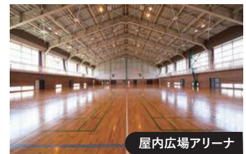
屋内広場アリーナ