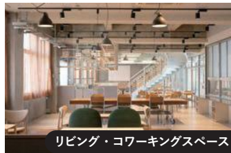
リビング・コワーキングスペース