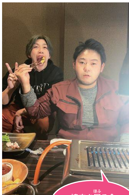
ほふ 焼肉を屠る会 開催中