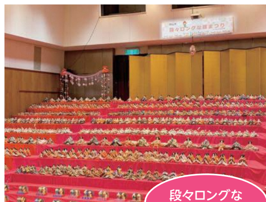
段々ロングな ひな祭り