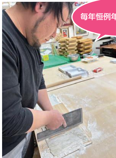
毎年恒例年越しそば打ち