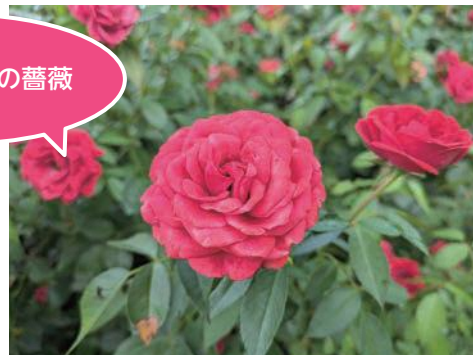
東沢バラ公園の薔薇