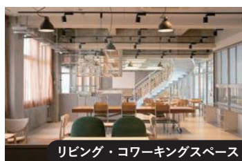
リビング・コワーキングスペース

まだLink MURAYAMAに来たことがない方は、ぜひ一度遊びにいらしてください!