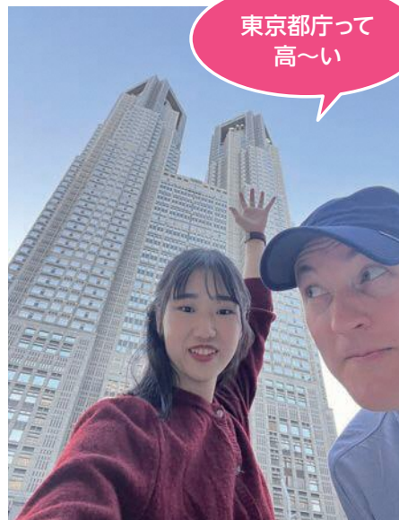
東京都庁って 高～い