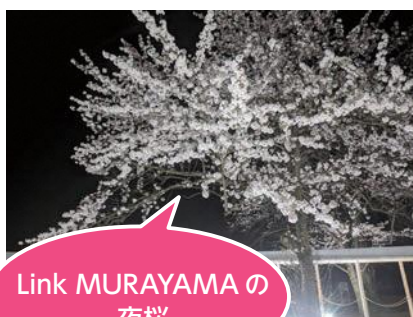
Link MURAYAMA の 夜桜