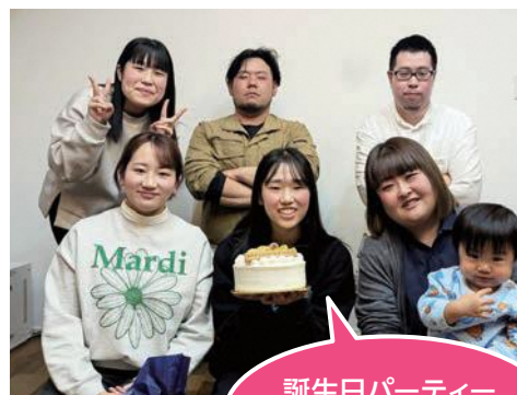
誕生日パーティー ケーキ美味しかった！