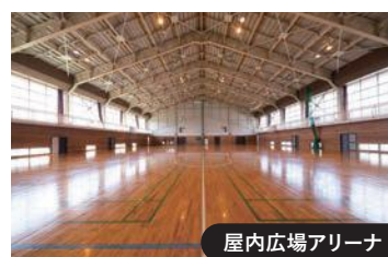
屋内広場アリーナ