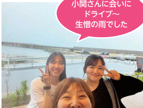
小関さんに会いに ドライブ～ 生憎の雨でした