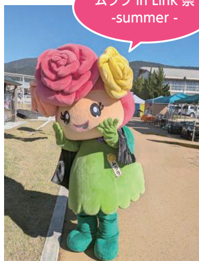
ムララ in Link 祭 -summer -