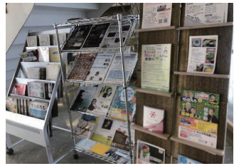
市内のイベントチラシや新聞を設置しています。