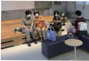
小上がりはゆっくり腰掛けるのにちょうどいい高さ。

旧校舎の古材を再利用した小上がりは、お子様が靴を脱いで遊んだり、イベントの時はステージにしたり。用途に合わせて配置を変えて利用できます。