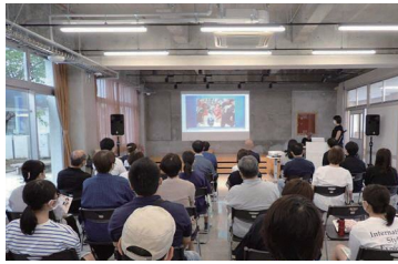
リビングで講演会を開催。資料を壁に投影することも出来ます。

カフェを挟んだ東側は、打合せや、作業もできるスペースです。中央にあるのは、教壇をリメイクした大テーブル。夕方になると、勉強する学生も訪れます。フリー電源もありますので、携帯の充電はこちらでどうぞ。