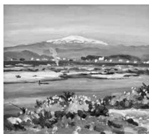
真下慶治作「秋 最上川 天童市寺津」