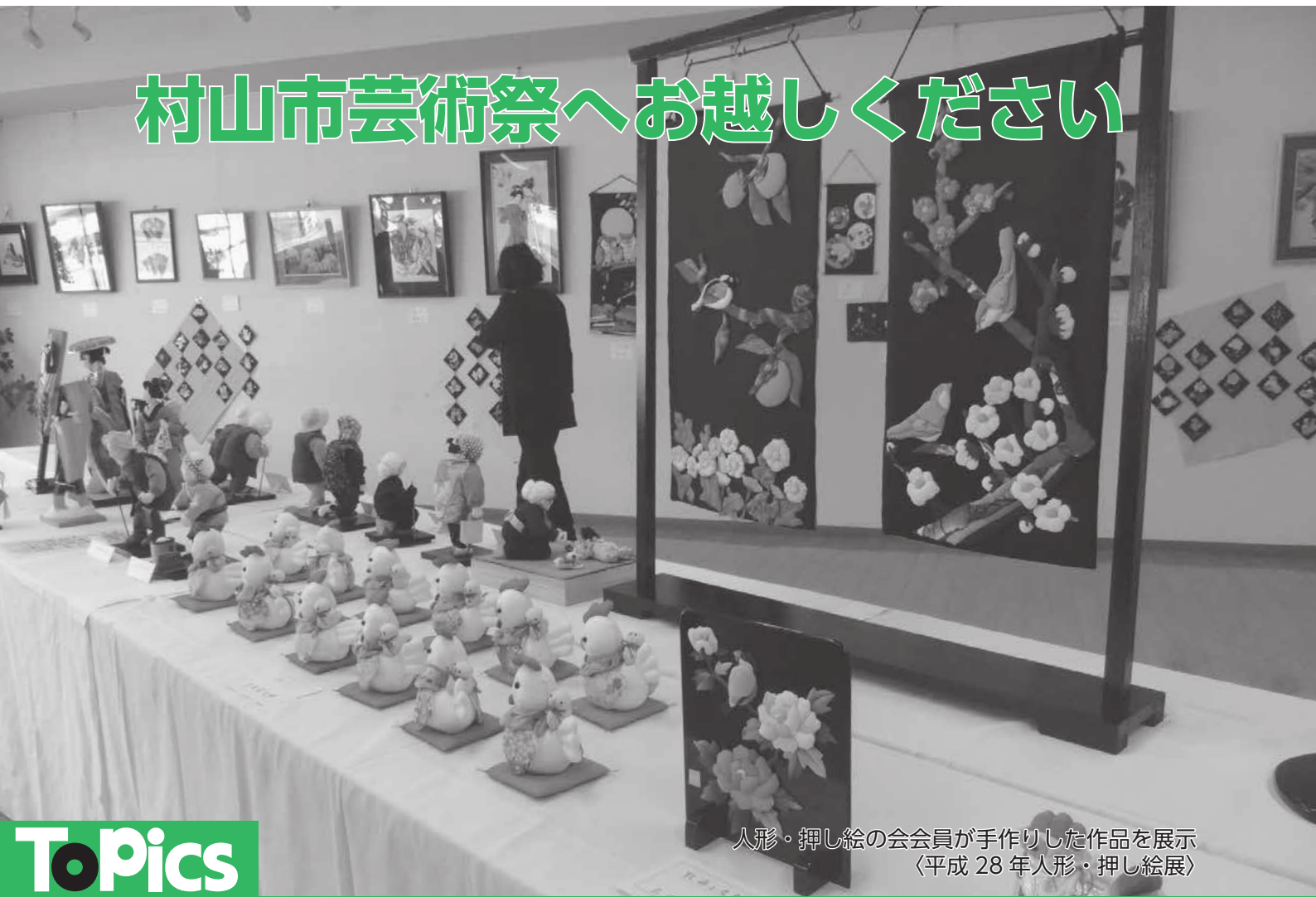
人形・押し絵の会会員が手作りした作品を展示 (平成28年人形・押し絵展)