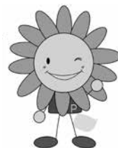
市健康づくりキャラクター ぼっぴー