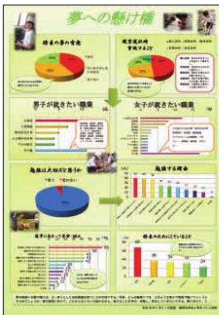
↑県統計グラフコンクール受賞作品「夢への懸け橋」。 将来の職業について2年生131人にアンケートをと り、わかりやすいグラフで表しました。

楯岡中学校生徒会の今年度のスローガンは「全力・全進・全開」です。全員が全力で同じ方向に向かって進み、大きく花を開かせるといった意味が込められています。このスローガンのもと勉強や部活動などに取り組んだ結果、今年、さまざまな分野で成果をあげることができました。