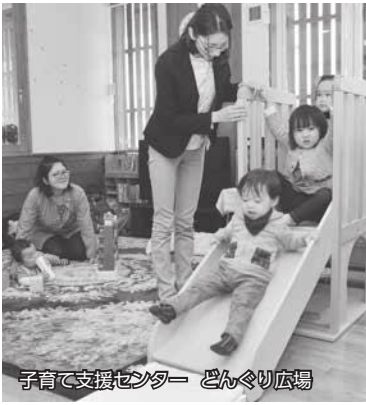
子育て支援センター どんぐり広場