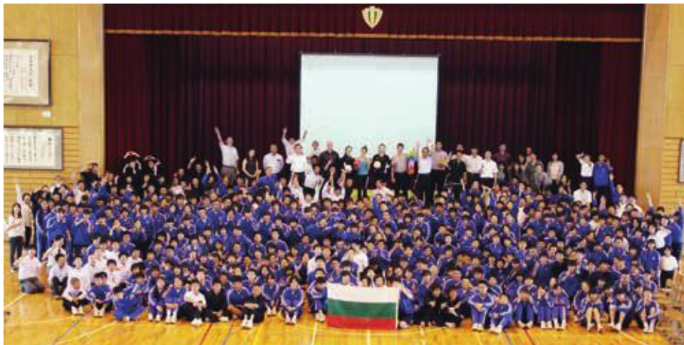
↑ブルガリア新体操選手団が学校訪問をした際、選手団と生徒全員で記念撮影