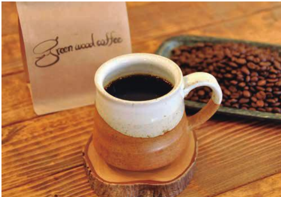
住所：稲下21-5 電話：48-6984 営業時間：午前9時30分～午後6時 定休日：水曜日（12月31日から1月3日はお休み）