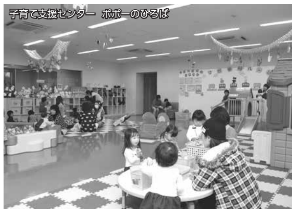
子育て支援センター ポポーのひろば

子育て支援センターポポーのひろばは、甄葉プラザ2階にあり、NPO法人ポポーのひろばが運営をしています。就学前のお子さんと親、祖父母を対象とした屋内広場です。利用と協力の会員によるファミリー・サポート・センター事業も行っています。