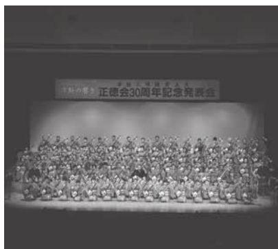
120人の三味線演奏者による大合奏

また、市内各民謡会や杉島諏訪太鼓保存会、名星太鼓ばあちゃん連も演奏を披露し、会場からは大きな拍手が送られていました。