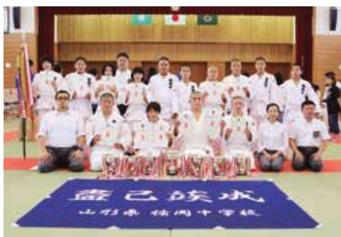
↑優秀な成績を収めた柔道部