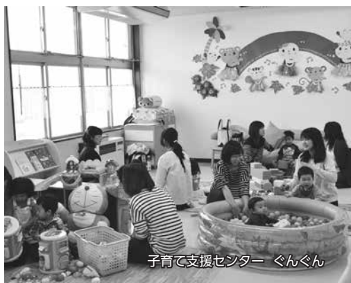
子育て支援センター ぐんぐん

市内の公立保育施設に向向き、保育施設等に入所前の親子を対象に、体操や手遊び、工作などで楽しく交流しています。