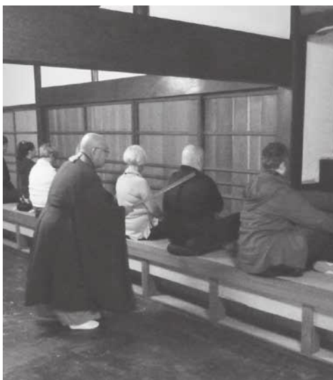
↑視察で訪れた祥雲寺で座禅を体験