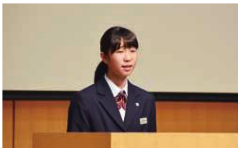
↑全国大会出場を決めた英語弁論