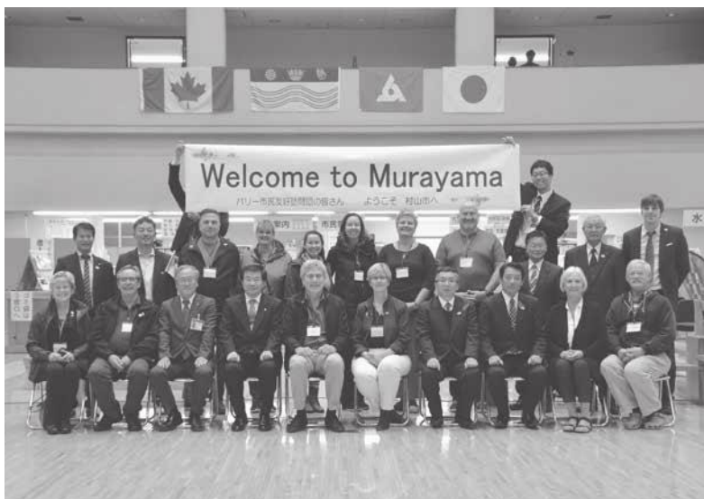
↑バリー市民友好訪問団の皆さんが市役所を表敬訪問