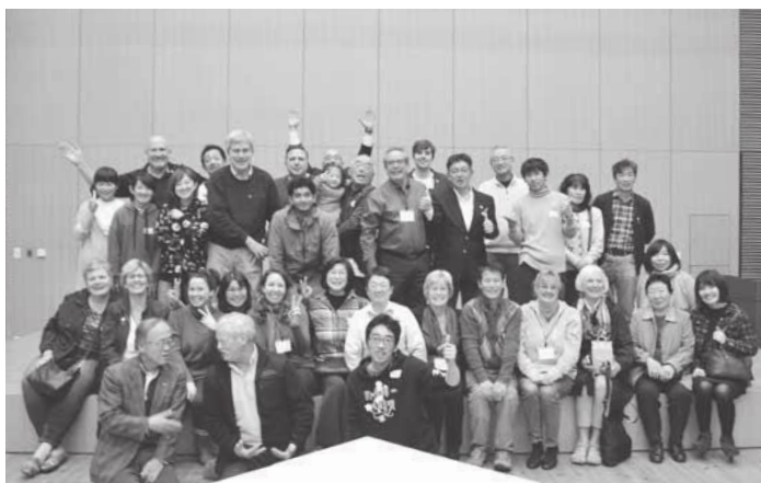
↑さよならパーティーの最後に訪問団とホストファミリーの皆さん全員で記念撮影