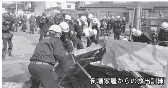
倒壊家屋からの救出訓練

また、東日本電信電話(株)の協力により、訓練開始時に緊急速報メールの配信や災害伝言ダイヤルの体験会などもおこなわれ、参加者たちは真剣な表情で訓練に取り組んでいました。