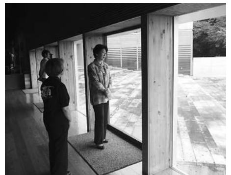
▲真下慶治記念美術館