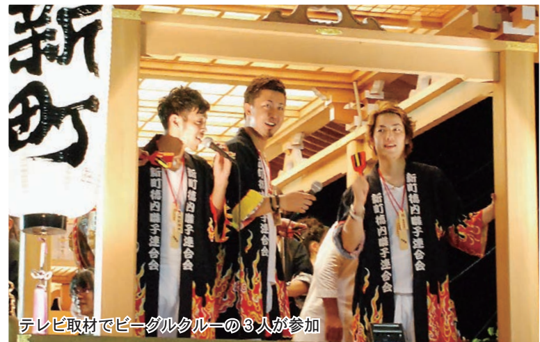
テレビ取材でピーグルクルーの3人が参加