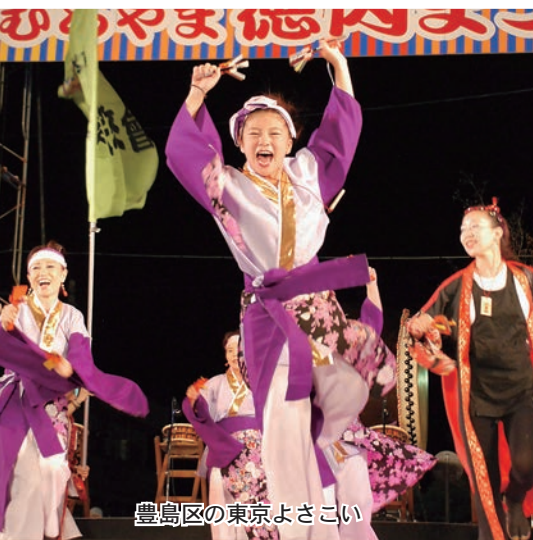
豊島区の東京よさこい