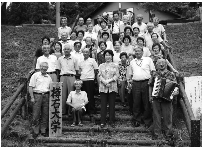
▲樽石大学（戸沢） 知事を歓迎して地域の方々も集まり、大学の前で記念撮影