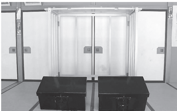
湯野沢奴のはさみ箱（2箱）とはさみ箱飾り立て（奥）