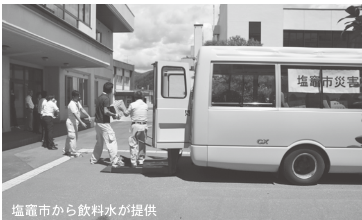
塩竈市から飲料水が提供

災害時における相互支援協定を締結する宮城県塩竈市からは、断水が始まった翌日の十九日から計五日間の給水車の応援があり、合わせて大量のペットボトル飲料水の支援をいただきました。また、たくさんの方の関係団体からも飲料水の提供をいただき、民生委員児童委員の協力を得て、援護を必要とする高齢者世帯や介護施設などに配ることができました。