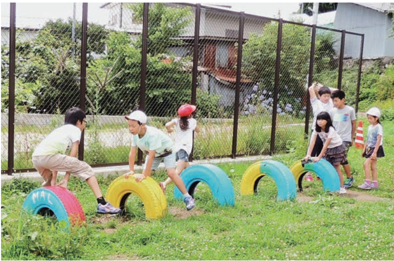
↑親子行事で設置したタイヤの遊具でじゃんけん陣地取り遊び

子どもたちが楽しく体力づくりを行える環境づくりのため、今後も工夫しながら取り組みを進めていきます。