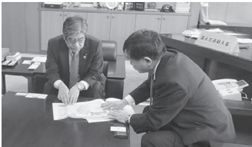
国土交通副大臣へ市の要望を説明