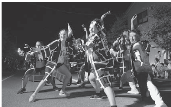
荒町あ組と一緒に徳内まつりに参加した訪問団のみなさん

8月17日から29日までの13日間、高校生9人と指導者2人からなるカナダ・バリー市の青少年訪問団が村山市を訪れ、中学生や高校生と交流しました。滞在期間中は、東沢バラ公園や最上徳内記念館の見学のほか、そば打ちや座禅、居合道の体験などを行い、徳内まつりへも参加しました。また、6泊を市内のホストファミリー宅にホームステイし、日本の文化や生活への理解を深めました。