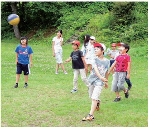
↑低学年も力いっぱいボールを投げるドッジボール