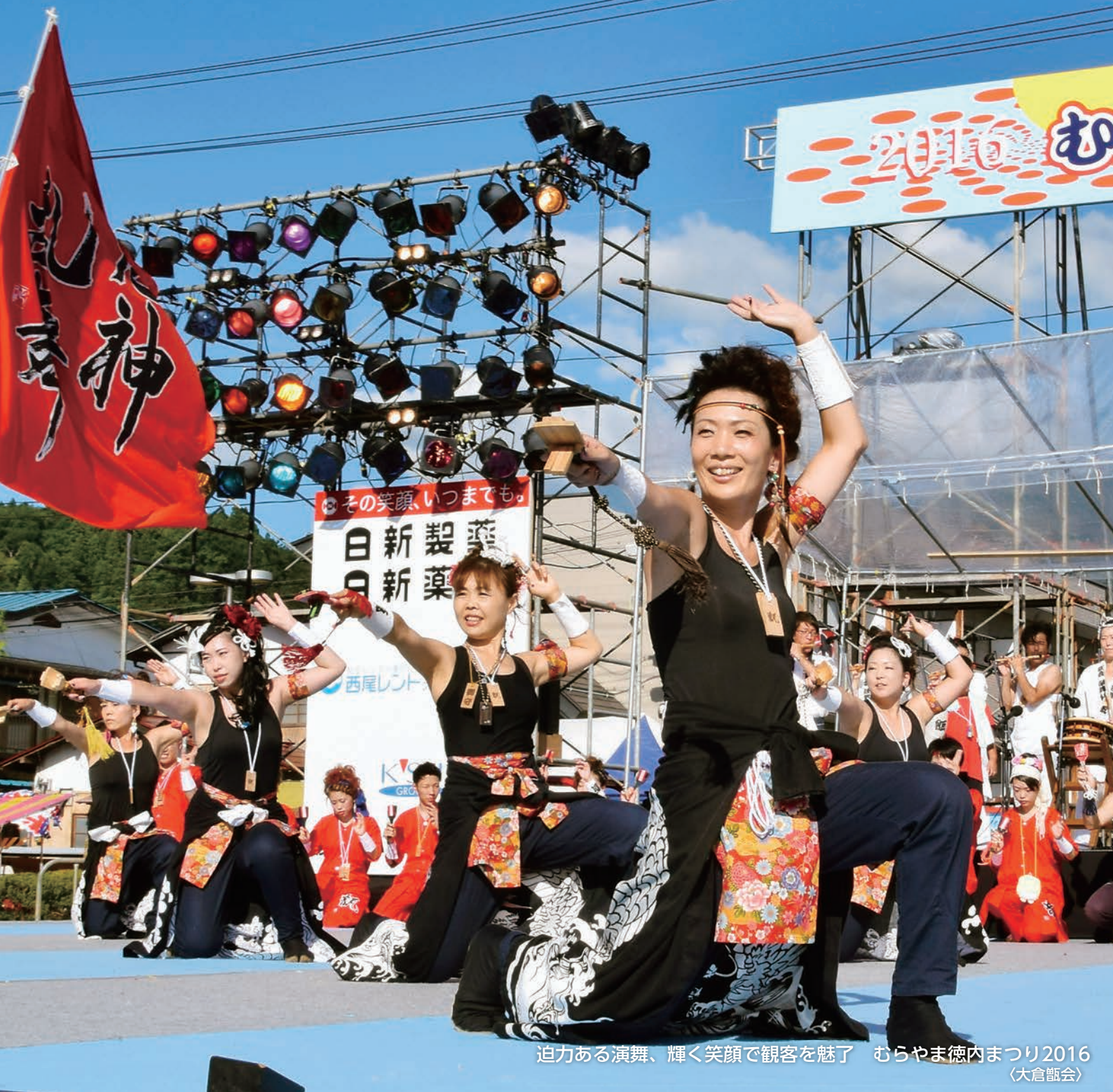
迫力ある演舞、輝く笑顔で観客を魅了 むらやま徳内まつり2016 (大倉節会)

村山市役所 TEL: 55-2111 (代) FAX: 55-6443 www.city.murayama.lg.jp