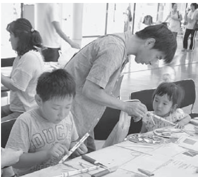
割りばし鉄砲を親子で一緒に作成

祭りでは、遊びや工作を楽しむ体験コーナーのほか、バクダン菓子の振る舞いやキッズダンスの披露、消防車などの展示が行われました。また、子ども服やおもちゃ、絵本の交換会も同時開催され、大勢の親子が訪れていました。