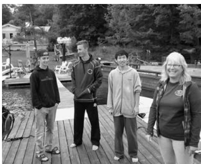
ホストファミリーと別荘の舟着き場で会話を楽しむ訪問団員