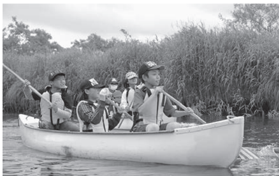
厚岸町を流れる別寒辺牛川をカヌーで下る児童たち

市内の小学生11人が7月26日から29日まで、友好都市締結25周年を迎えた北海道厚岸町を訪れ、同町の小学生とともにさまざまな体験をしました。滞在期間中は、地引き網漁やカヌーでの川下りなど、厚岸町ならではの活動を体験。また、野外炊飯では北海道の郷土料理「鮭のちゃん焼き」にも挑戦しました。参加した児童たちは、村山市ではできない体験をとおして、厚岸町の児童と楽しく交流を深めていました。