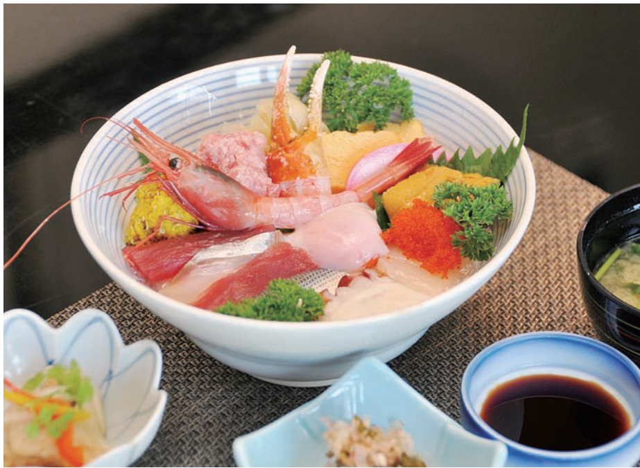
住所：河島乙377 電話：55-3800 営業時間：午前11時30分～午後2時、午後5時～10時 定休日：火曜日 ※5人以上でおこしの際は、事前にご連絡ください。