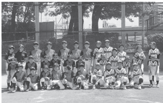
台東区選抜チーム（左）とオール村山チーム（右）

市内の少年野球選手から選ばれたオール村山チームが、8月5日から7日まで友好都市である東京都台東区を訪れ、同区の野球チームと試合などを通して交流を深めました。村山市からは14人の選手が参加。初めに台東市役所を表彰訪問し、その後、台東区の選抜チームと3試合を行いました。村山市から訪問した選手たちは、滞在期間中に台東区の選手宅にホームステイし、さらに友情を深めました。