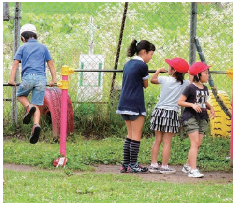
↑高学年が低学年に鉄棒のアドバイス