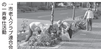
市老人クラブ連合会の一斉奉仕活動

企業・団体などで実施するボランティア活動の情報をお寄せください。市報で紹介いたします。