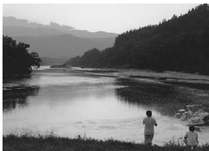
大淀の最上川を撮影した写真