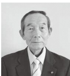
■市議会議長 細矢 清隆（大久保）