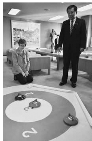
フロアカーリング