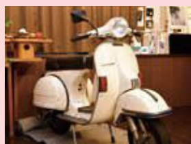
松田優作氏がドラマ撮影で使ったベスパ