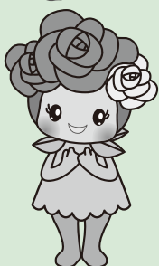
村山市公式キャラクター ムララ®