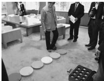
ミュージックパッド