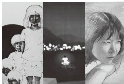
最上川未来アート展Ⅱ～記憶の縁側～より