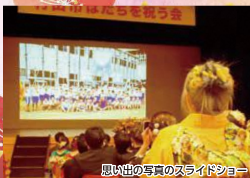
思い出の写真のスライドショー