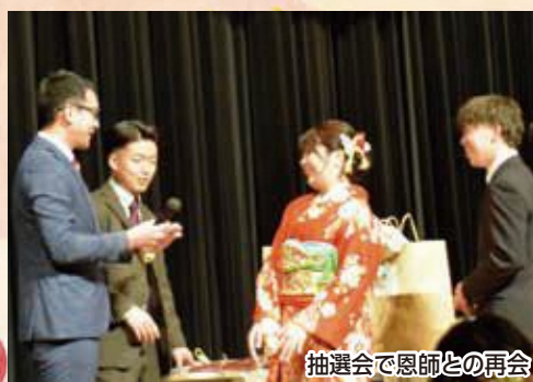
抽選会で恩師との再会