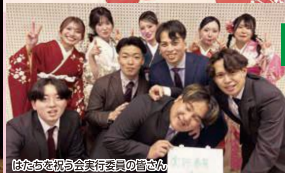
はたを祝う会実行委員の皆さん