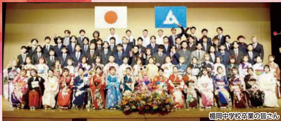
楯岡中学校卒業の皆さん