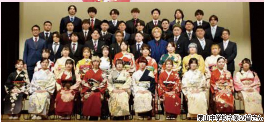
葉山中学校卒業の皆さん