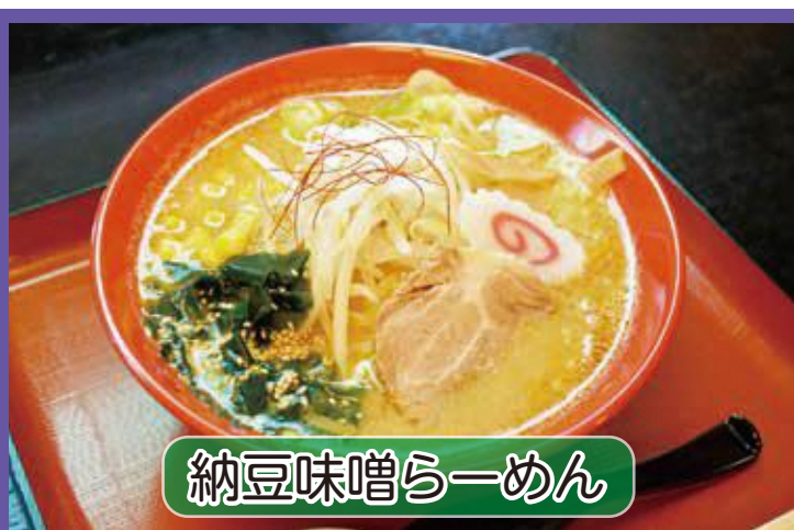
納豆味噌らーめん