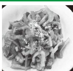
調理・紹介：橿岡地域食改の皆さん