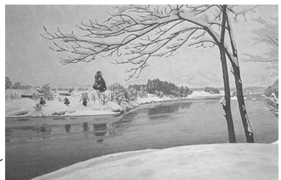
「雪の河畔」真下慶治作 1981年制作