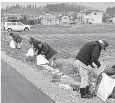
道路沿いの清掃を行う㈱矢萩土建の皆さん

この活動は、地元企業として地域に貢献しようと毎年ボランティアを実施しているものです。