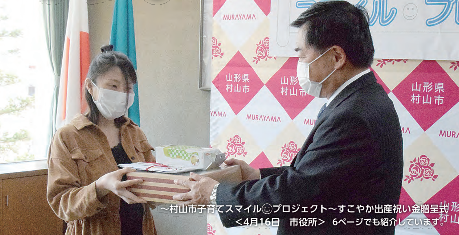
～村山市子育てスマイル☺プロジェクト～すこやか出産祝い金贈呈式 <4月16日 市役所> 6ページでも紹介しています。

村山市役所 TEL: 55-2111 (代) FAX: 55-6443 www.city.murayama.lg.jp