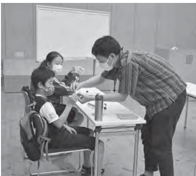
数学マジックを楽しみながら学ぶ生徒たち

参加した生徒および児童は、算数・数学を学ぶ楽しさや不思議さ、面白さを体験しました。