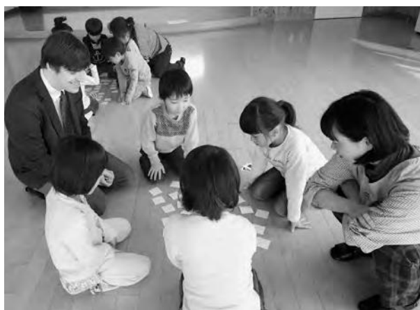
オランダに関するカードで神経衰弱