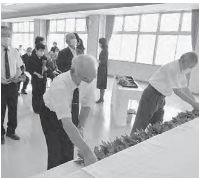
献花を行う参加者