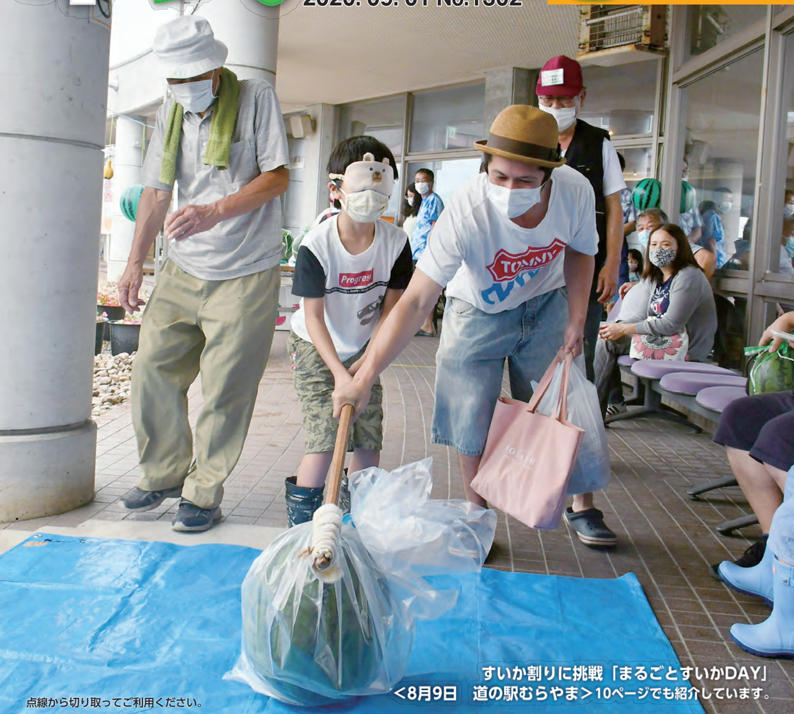
点線から切り取ってご利用ください。

村山市役所 TEL: 55-2111 (代) FAX: 55-6443 www.city.murayama.lg.jp