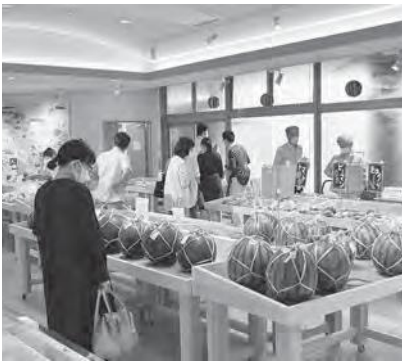
買い求めるお客さんでにぎわった道の駅むらやま

また、一杯200円で販売された芋煮も大好評で、行列ができていました。他にも、村山産業高校による農産物の販売や、ももまつりも同時に開催されるなど、多くの来場者でにぎわい、市内産の旬の農産物を買求めるていました。