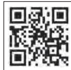
YouTubeページ チキンスープレシピ動画

※レシピ動画は、市ホームページ、YouTube「ROSECAMP.ch」、Facebook「ブルガリア新体操ローズキャンプ」で公開しています。