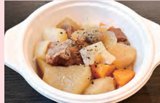
牛すじ煮込み塩味