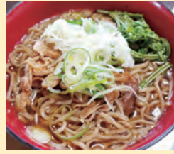
冷たい烏らあーめん