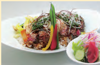
ビーフステーキ丼