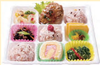
日替わりヘルシー弁当