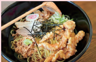
ぶっかけラーメン