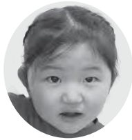
のと おとかちゃん