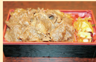
山形牛のすき焼き重