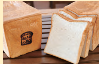
白っち(米粉食パン)