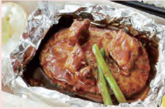
ミニ濃厚ビーフシチューの 包み焼きハンバーグ(ライス付き)