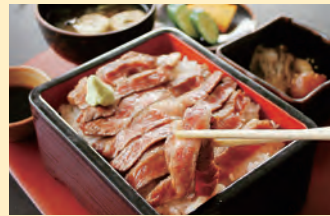
山形牛ステーキ重