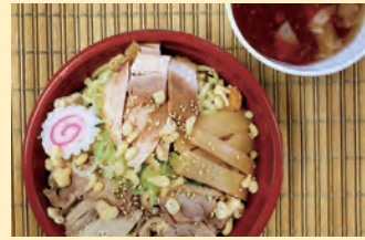
冷たい辛ガリつけ中華