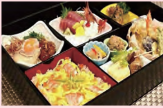
川島松花堂折詰め

●主なメニュー● 川島松花堂 折詰め 1,300円 お刺身ばん酌 1,000円～