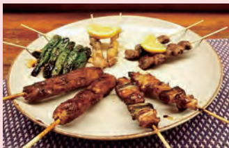
おまかせ串焼き盛り合わせ