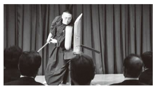
↑アトラクション「居合道演武」