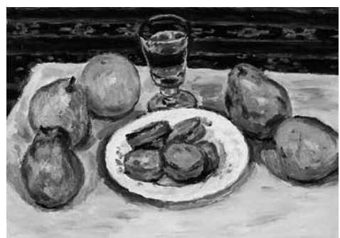
真下慶治作「ラ・フランスとビスケット」