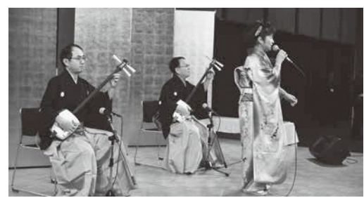
↑アトラクション「三味線・民謡 正徳会」

新しい一年の始まりを一緒にお祝いしませんか。 どなたでも参加することができます。会食は行わず、 式典のみとなります。定員150人。(事前申込制・参加無料) 日時 令和5年1月4日(水) 午後3時～ 会場 甕葉プラザ 申込期限 12月19日(月) 申込先 総務課、各地域市民センター ■申込み・問合せ／総務課庶務係 ☎内線211