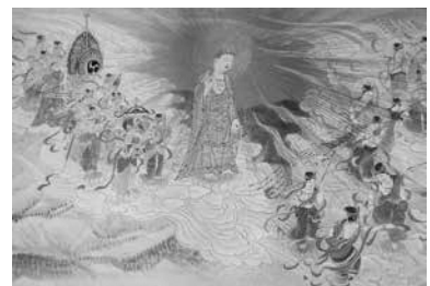
釈迦と二十七部衆「慈母浄土来迎図絵巻」より