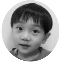
あびこ とおりくん