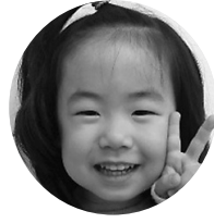
くどうくりあちゃん