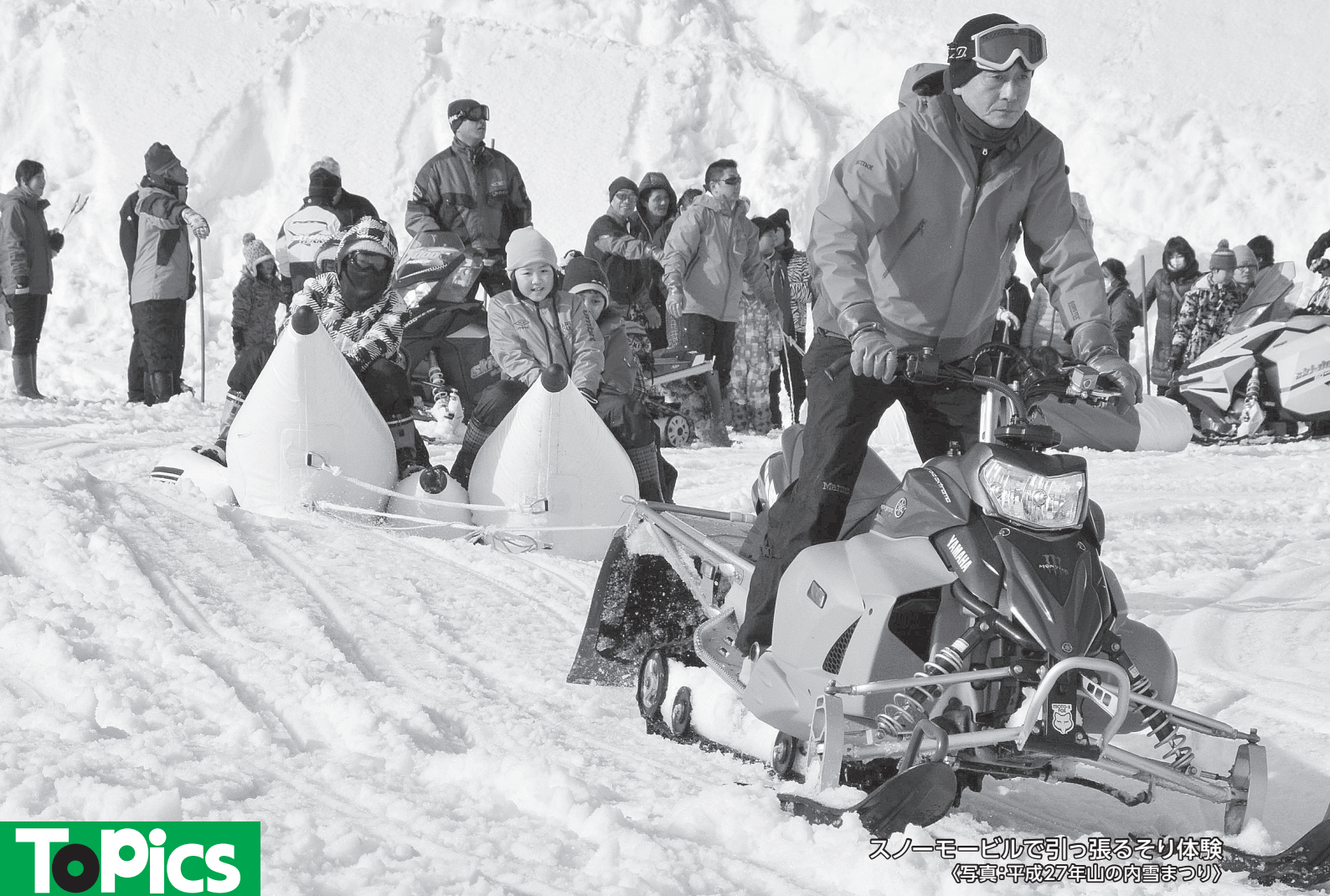
スノーモービルで引っ張るそり体験 《写真:平成27年山の内雪まつり》