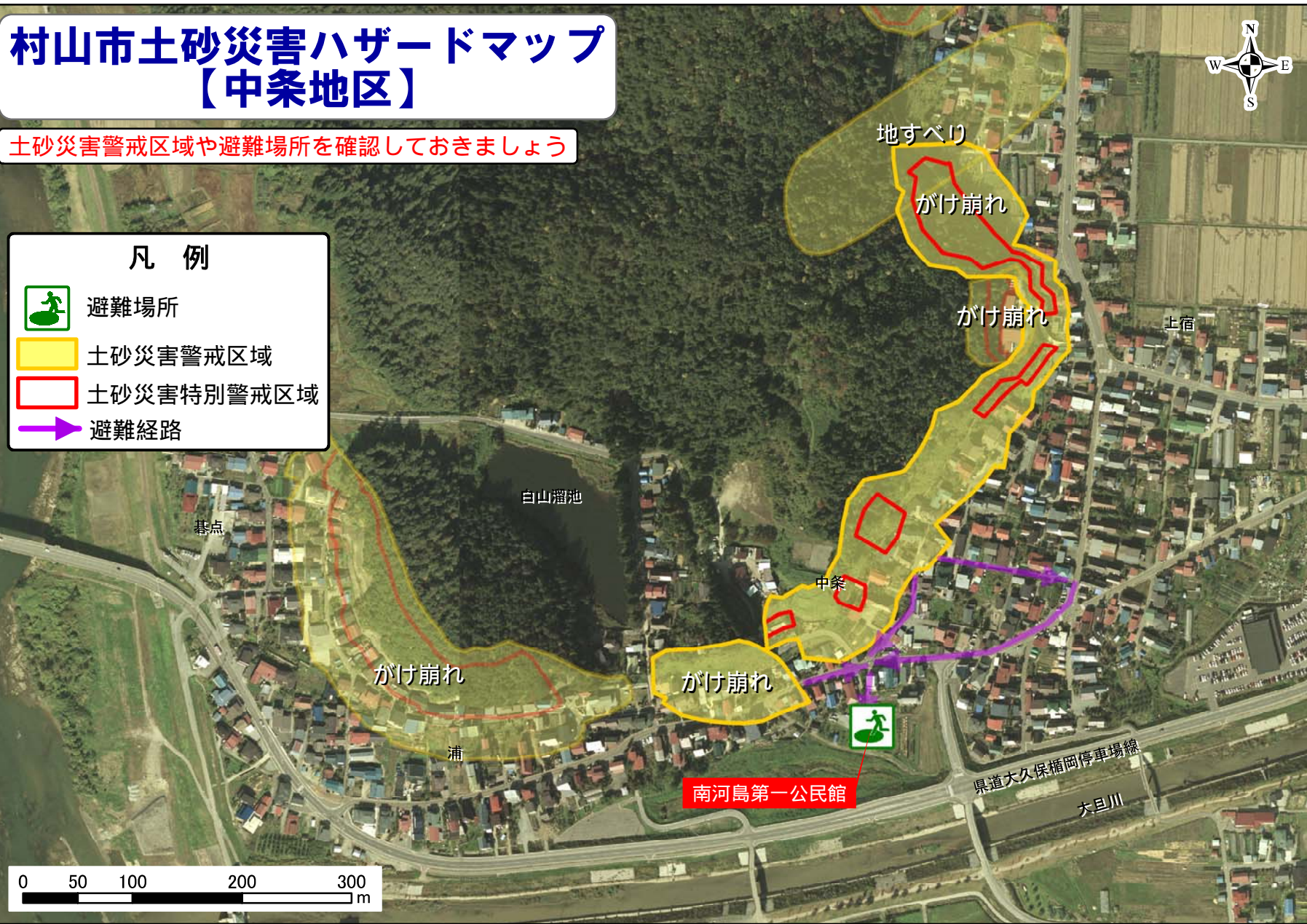
航空写真撮影年度：平成12年度