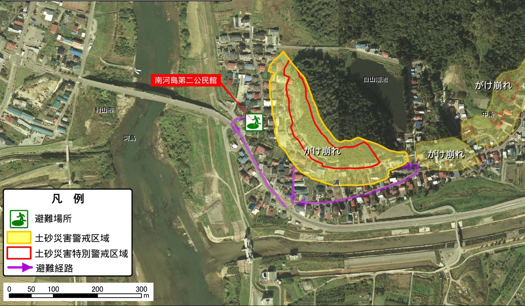
航空写真撮影年度：平成12年度