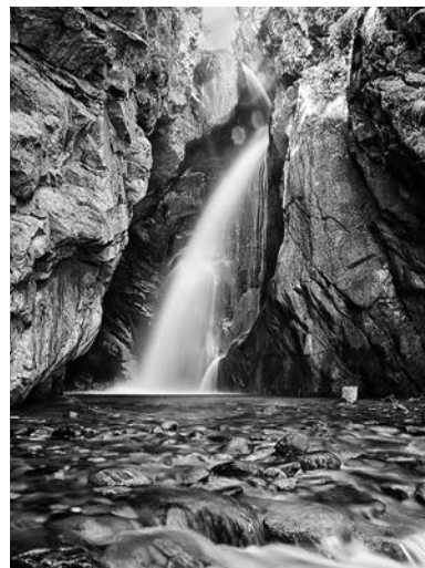
「フォティンスキー滝」フォティンヴォ村 ロドヒ山脈/2017年8月