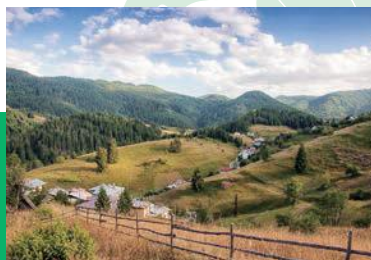
「ロドピ山脈の美しさ」ストイキテ村 ロドピ山脈/2017年9月