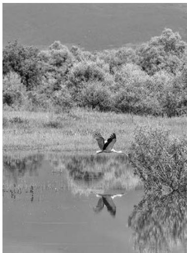
「春が来る」コプリンカタム カザンラック市周辺/2016年4月