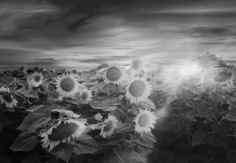
「夕暮れのヒマワリ」プロフディフ市周辺/2018年7月