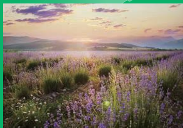
「カロフェル市の近くのラベンダー畑」2016年6月