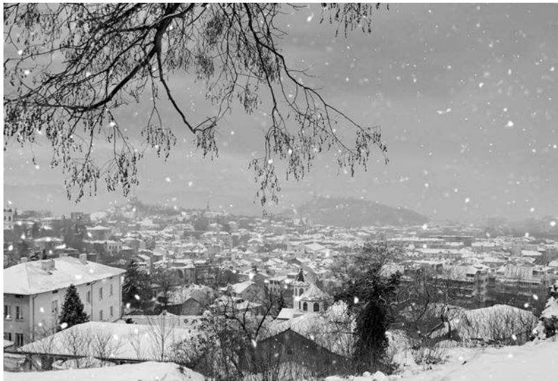
「プロフディフの冬」プロフディフ市 ネベツ・テベ丘/2016年1月

ブルガリア共和国在住の芸術家による、ブルガリアの自然や力強く美しい人物像を皆様と共有し、異文化理解や共生の精神を学ぶ機会になれば、と祈念いたします。