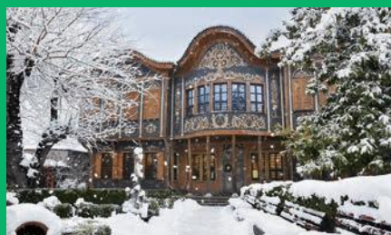
「民族博物館の冬」プロフティブ市 旧市街/2016年1月