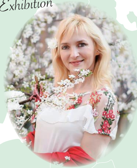
フォトグラファー ディミトラ・レフテロヴァ Dimitra Lefterova ブルガリア共和国／プロフティブ市在住

セレモニー終了後の午前中に、レフテロヴァ氏による作品の解説を予定しています。 参加自由ですので、お気軽にお出でください。