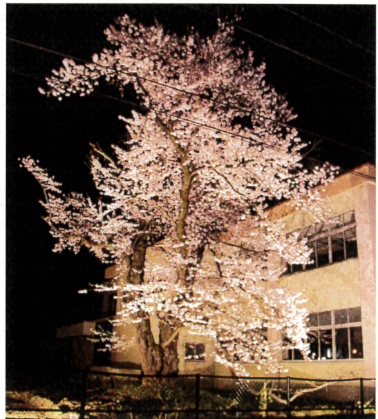
講堂跡地に咲く桜は樹齢80年。

4月12日から22日まで、西側道路沿いの桜を校舎と一緒にライトアップしました。満開の時期は大迫力。とても美しく夜空に浮かび上がりました。