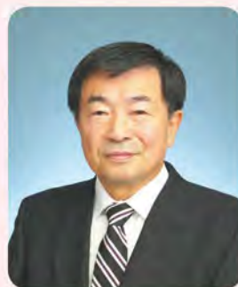
村山市長 志布 隆夫