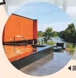
◀露天風呂 ▲スパプール