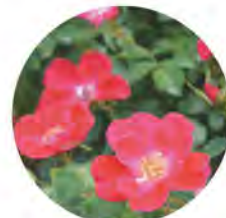
市の花 バラ (写真:市オリジナルバラ「むらやま」)