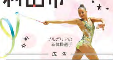
ブルガリアの 新体操選手