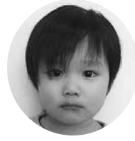
せいの とうわくん