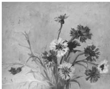
【八車草】 真下慶治作