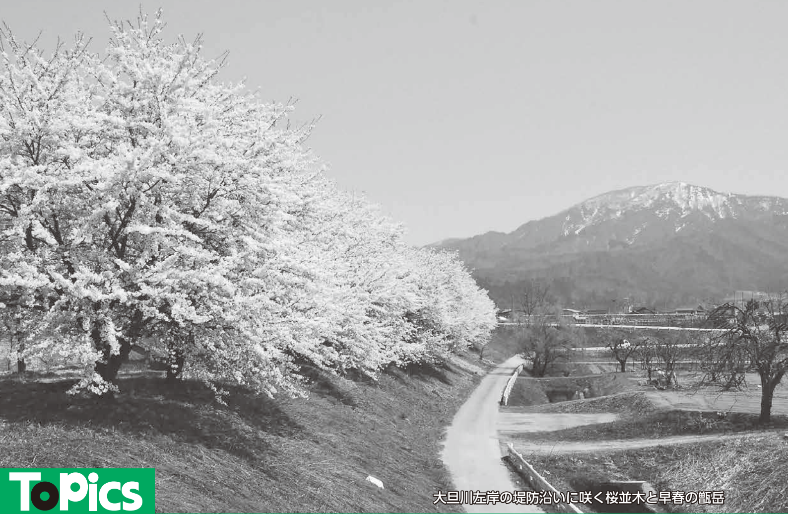
大旦川左岸の堤防沿いに咲く桜並木と早春の甑岳