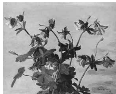
【すみれ】 真下慶治作