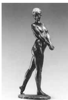
高橋剛作「裸婦立像」