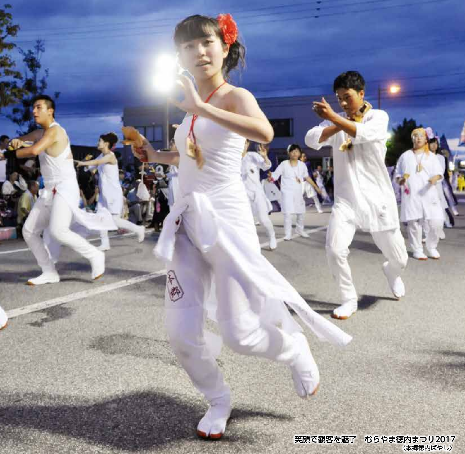
笑顔で観客を魅了 むらやま徳内まつり2017 (本郷徳内ばやし)