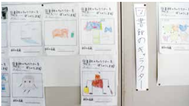
←図書館のキャラクター募集に 寄せられた応募作品

富本小学校では週3日、10分間の朝読書時間を設定し、個人での読書のほか、図書委員が絵本や紙芝居を友達に見せ、読んであげています。授業でもペアやグループでの読み聞かせを行っており、地域のボランティア「まつぼっくり」の皆さんによる読み聞かせも実施。「まつぼっくり」の皆さんからは全校児童を対象にした年2回の「お話し会」にも協力をいただいています。 6月と11月の「読書がんばり月間」では図書コーナーに足を運んでもらおうと、図書委員会が図書に関するクイズや図書館のキャラクター募集、イラストコンクールなどを企画しています。