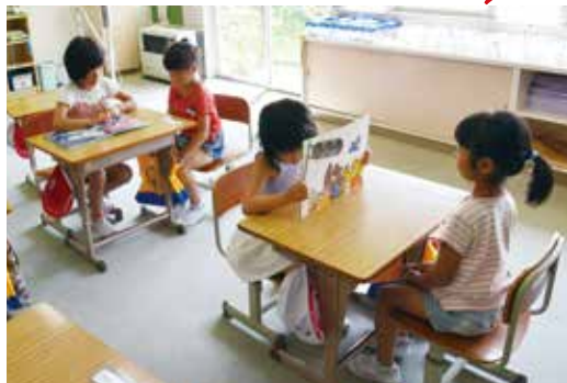
↑2人ペアでの読み聞かせ