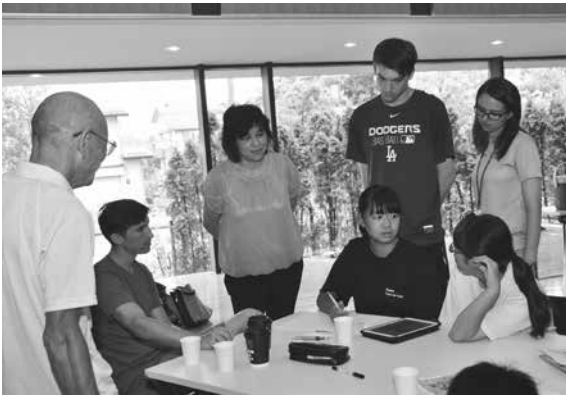
市内の散策を終え、発表に向け話し合う参加者

市教育委員会では、英語力を身につけ、将来に生かそうとする子どもを育てるため、GOGO!むらやまインターナショナルキッズ事業を実施しています。事業では、「英語を将来の職業に生かしたい」という中学生のために「グローバルキッズ講座」を開講し、地域の魅力を発信するための体験活動を外国人講師と一緒にしています。また、市内小中学校では「魅力ある外国語授業」を目指し、授業研究会を行っています。