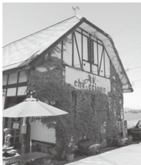
アル・ケッチャーノ