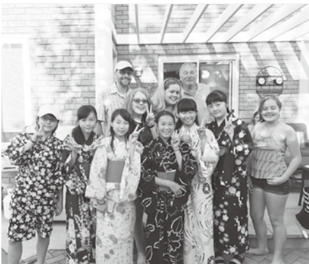
ウェルカムパーティーには浴衣で参加

8月17日には報告会が行われ、参加した生徒は「カナダの大自然と本場の英語に触れられる貴重な体験となった」「今後は現地でも通用する英語力を身につけたい」など訪問を通して感じたことを発表していました。