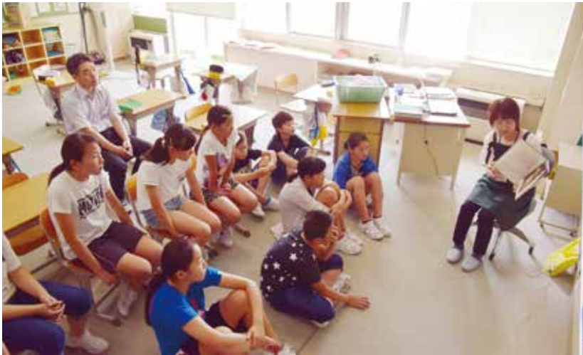
↑「まつぼっくり」の方による朝読書での読み聞かせ