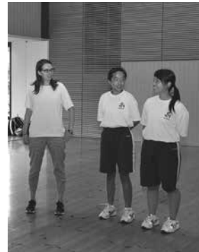
英語での自己紹介ゲームの様子