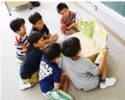
↑仲間との読み聞かせ