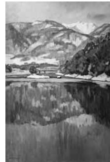
真下慶治作「最上川冬」