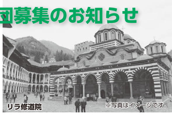
リラ修道院 ※写真はイメージです。

村山市は東京オリンピック・パラリンピックでブルガリア共和国のホストタウンとして登録され、平成29年度からブルガリア新体操チームが事前キャンプを実施しています。 ホストタウン事業をととして、市民スポーツの振興、国際的な人的・文化的交流などを推進していくため、このたび市民訪問団を募集し、交流事業を行います。