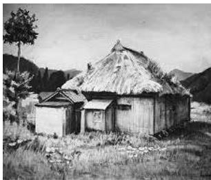
山形大学 本間かりん作 「在りし日」