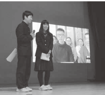
中継でモンゴルの高校生と交流する村山産業高校の生徒

また、2月1日に同校と教育交流に関する協定を締結した新モンゴル学園（モンゴル・ウランバートル市）の高校生もインターネット中継で意見を述べたり質問したりするなど交流を図り、有意義な発表会となりました。