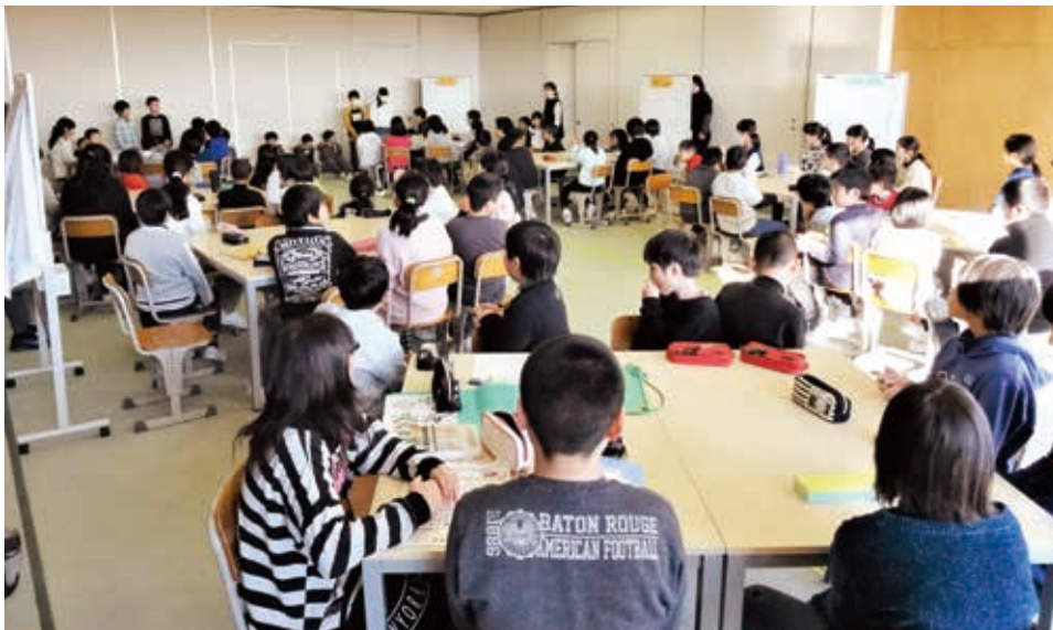
↑ オープンスペースにすべての委員会が集合し、委員会活動を実施