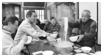
ひっぱりうどん差入れの様子