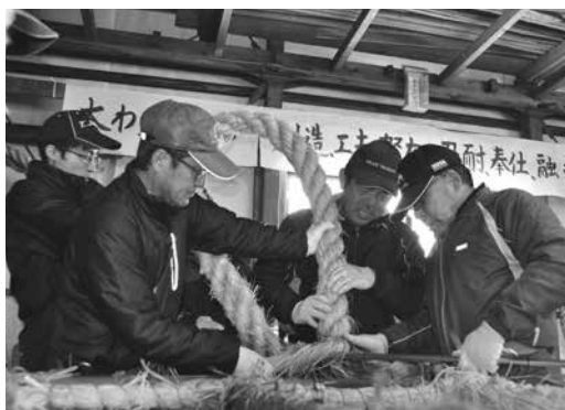
大わらじ製作に集中する楯岡荒町地区の皆さん