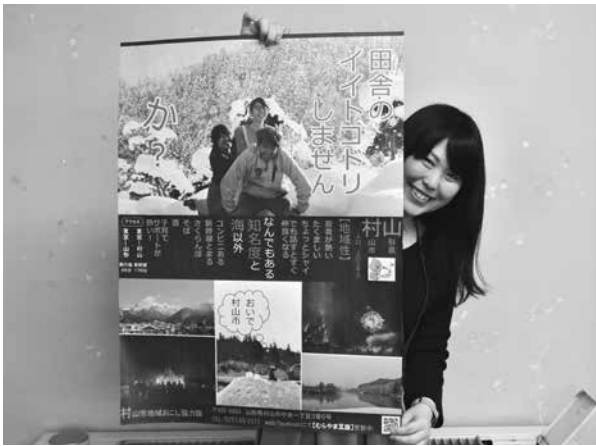
冬のポスターをつくりました！