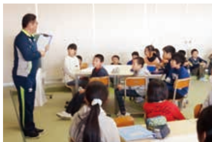
↑ 活動の最後に総括として職員がアドバイス