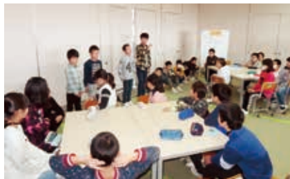
↑ その日の活動について各委員会ごとに発表