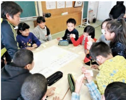
↑ 付せんに書き込んだいろいろなアイデアを大判の紙に貼りつけながら提案し、話し合う子どもたち