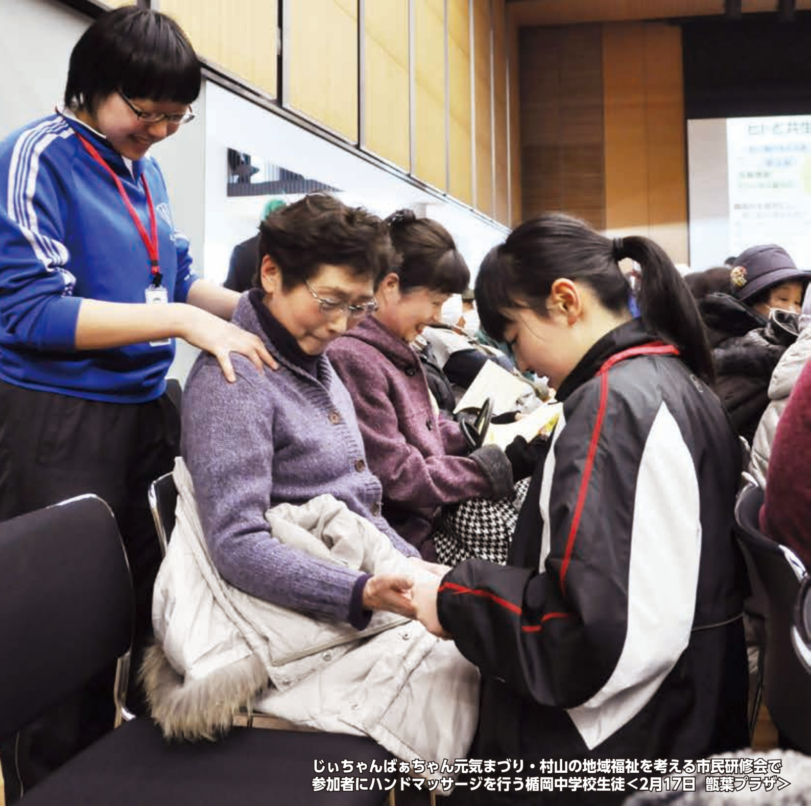
じいちゃんばあちゃん元気まつり・村山の地域福祉を考える市民研修会で参加者にハンドマッサージを行う楯岡中学校生徒<2月17日 甕薬プラザ>

村山市役所 TEL: 55-2111 (代) FAX: 55-6443 www.city.murayama.lg.jp