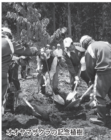
オヤマザクラの記念植樹

初めに三十年目を記念して生徒代表らがオヤマザクラを植樹しました。続いて、木と葉山の森の関わりや植林方法の説明を受け植林場所へ移動。生徒たちは四人から六人の班に分かれ、ふるさと森へ思いを込めながら丁寧に苗木を植えました。