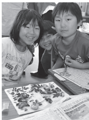
3年生の押し花づくりの様子

をきれいに並べるのが難しかった」「家でもやってみよう」と楽しみながら取り組んでいました。この作品は東沢公園内のバラ交流館などに飾られ、たくさんの来館者を歓迎します。子どもたちの力作をどうぞ、ご覧ください。