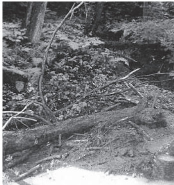
昨年9月に発生した林道岩野大寺院線の土砂流出災害

避難場所は、地区ごとに定められています。平成19年度に配布した「災害時対応マニュアル」で、地区の避難場所や避難経路を普段から確認しておきましょう。