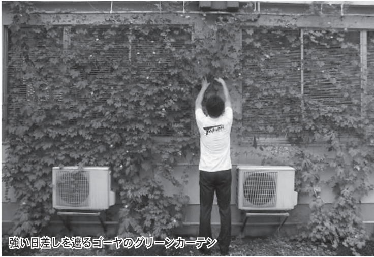
強い日差しを遮るゴーヤのグリーンカーテン