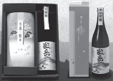
地元の商品も扱っております。