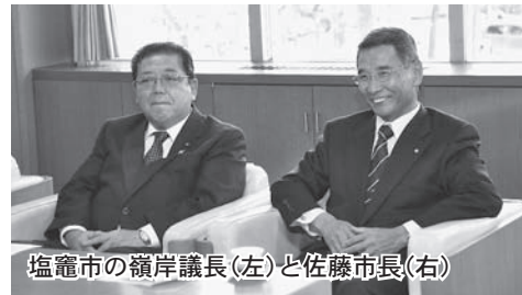
塩竈市の嶺岸議長(左)と佐藤市長(右)

更には、塩竈市震災復興計画が昨年十二月に策定され、塩竈市民の暮らしとまちの復旧・復興に向けた整備などが今後着々と進められます。