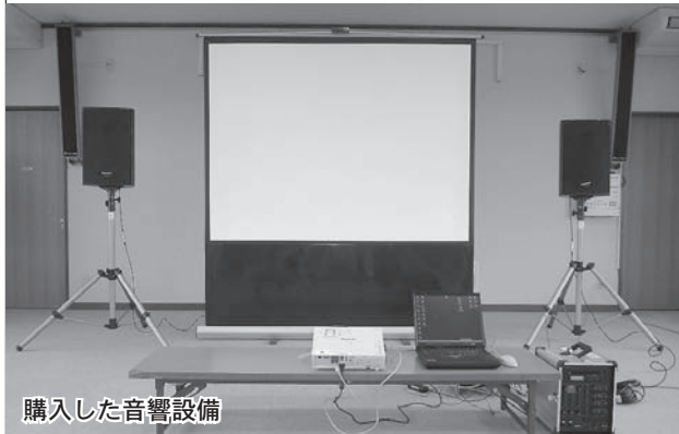
購入した音響設備

これは、財団法人自治総合センターの一般コミュニティ助成事業による助成を受けたものです。地域活動をおこなう際に必要な音響設備やテーブル、イス、テント等を購入し、各種イベントなどの際に活用していきます。