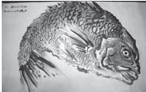
岸駒(がんく)「鯛」個人蔵