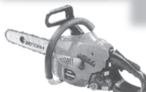
ゼノアチェーンソー-G3401EZ (35cmバー) 33.4cc 3.4kg 定価69,300円(税別) 56,300円