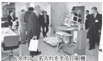
タオルに名入れをする印刷機

「わっしょい！」では、早速、タオルの名入れ作業などの依頼があり、就労に必要な知識や能力向上の訓練が始まりました。