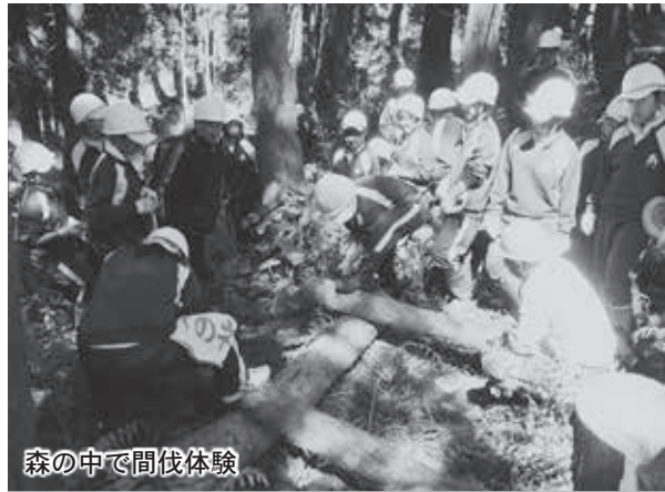
森の中で間伐体験

午後は、学校の教室では体験できない森の中の学習を実施。森林教室として「炭焼き体験」や「森の探検隊」、「間伐体験」など八つの講座に分かれ、貴重な自然学習をしました。