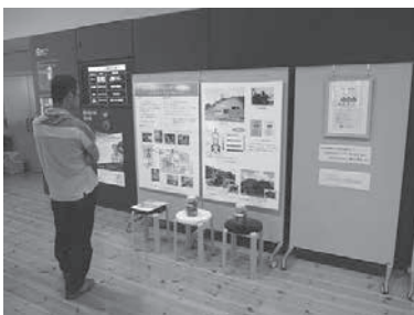
やまがたグリーンパワー(株)の発電の仕組み