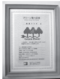
木質バイオマス発電 グリーン電力証書