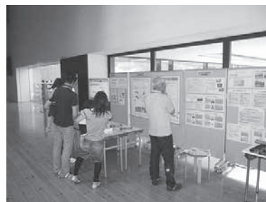
環境企業展示(ナブテスコオートモーティブ(株)、県環境科学研究センター、村山市役所)