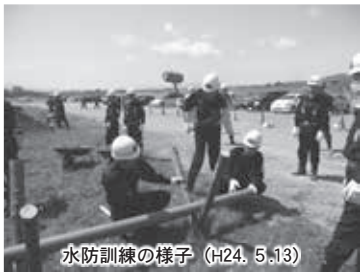
水防訓練の様子 (H24. 5.13)

市内の浸水想定区域図や土砂災害危険箇所図を掲載したハザードマップを市のホームページ「村山