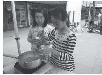
エコキャンドルづくり