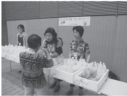
アサガオの苗無料配布