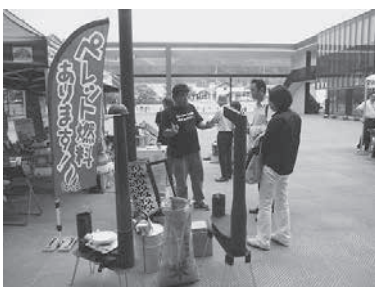
木質バイオマス燃焼機器 (エネルギーシフト山形勉強会)