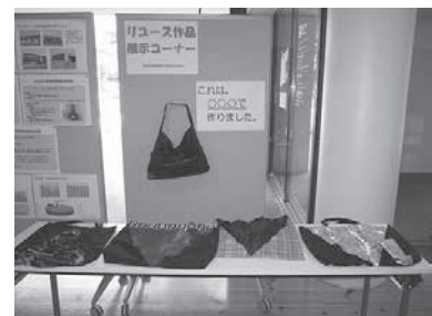
傘を使ったバッグ