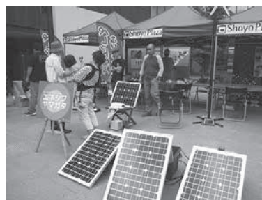
太陽光発電パネル (エネルギーシフト山形勉強会)