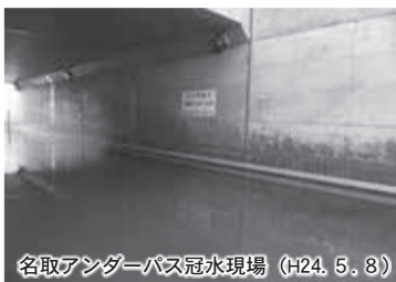
名取アンダーパス冠水現場 (H24. 5. 8)

低地やアンダーパスなど、道路が冠水している状況を見つけた場合は、水の中で立ち往生することもありますので走行しないようにしましょう。