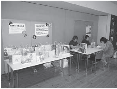
新聞バッグづくり(新聞バッグむらやま)