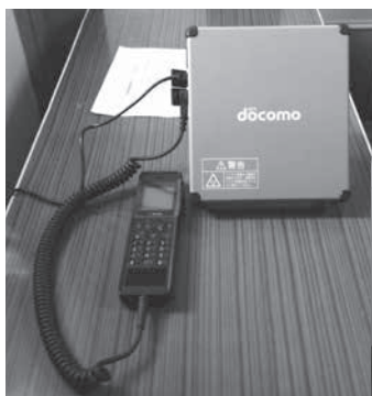
↑衛星携帯電話 (五十沢集落センターと山の内 自然体験交流施設やまばとに 配備)

この計画は、村山市において発生する恐れのある各種災害に対処するために必要な事項を定め、市民の生命、身体および財産を災害から守るものです。