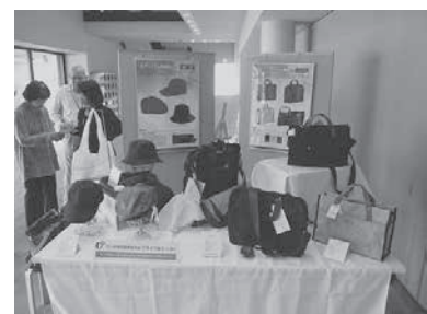
車のエアバッグやシートベルト を使ったリサイクル品 (株山形県自動車販売店リサイクルセンター)