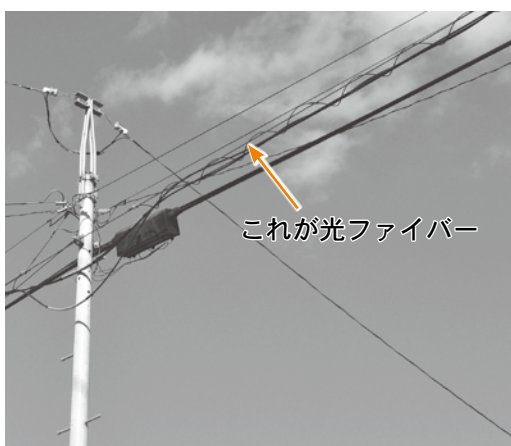
これが光ファイバー