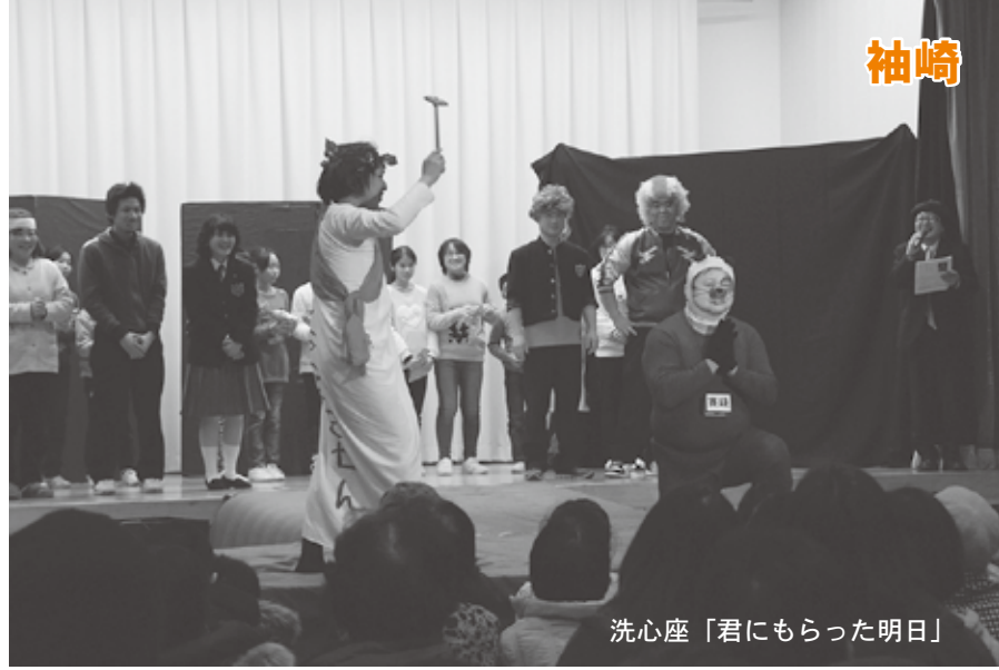
洗心座「君にもらった明日」