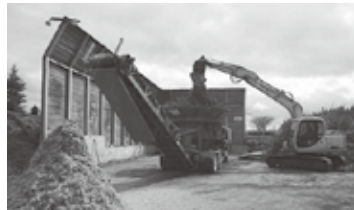
果樹せん定枝の破碎