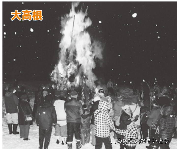
山の内の大おさいとう

2月22日 山の内雪まつり 県内外からたくさんの観光客が訪れる山の内雪まつり。今年も地域の方の心あたたまるおもてなしが会場にあふれていました。