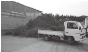
果樹せん定枝の搬入