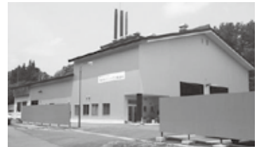
木質バイオマス発電