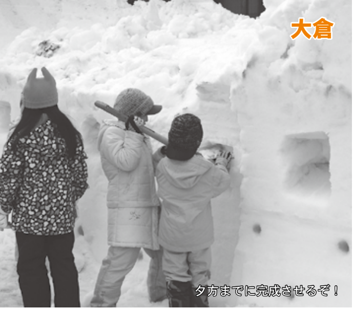
夕方までに完成させるぞ！