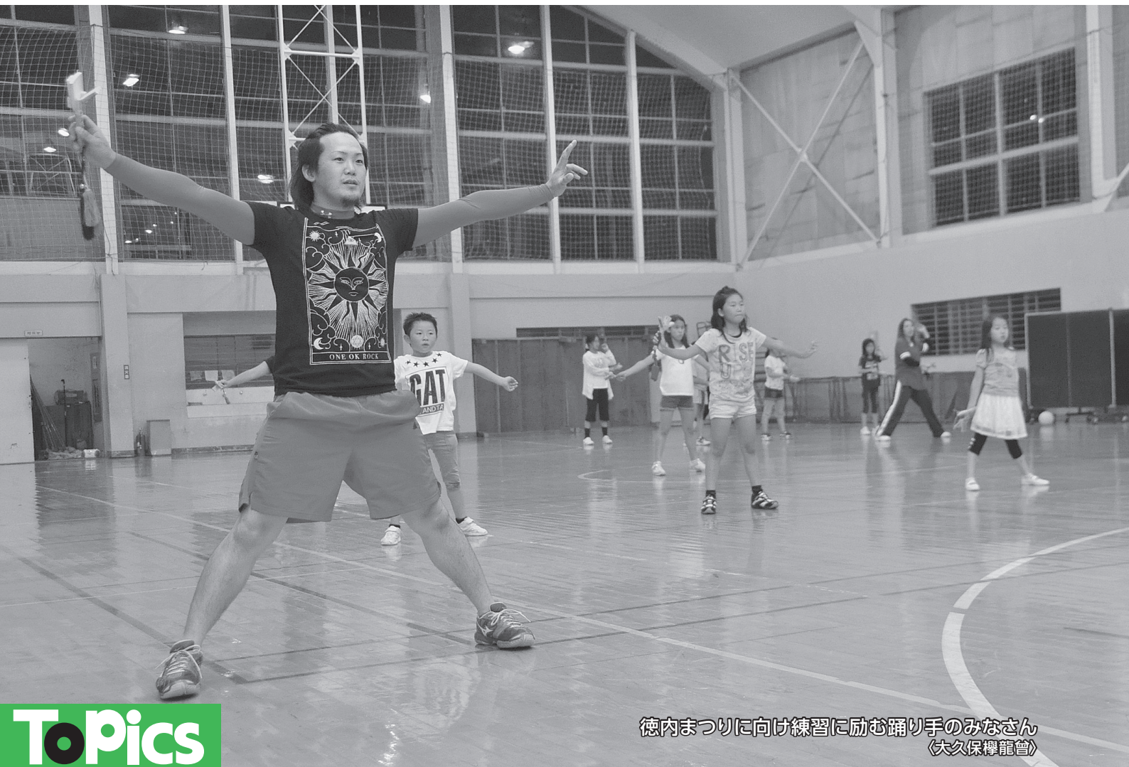
徳内まつりに向け練習に励む踊り手のみなさん (大久保擲龍會)