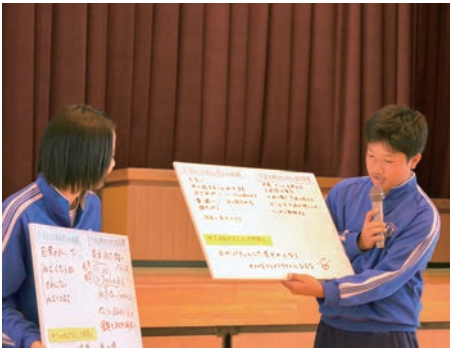
↑パワーアップミーティングで学んだことを発表