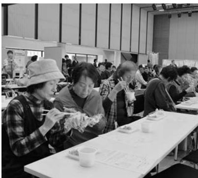
レシピを確認しながら Ca 噛むメニューを試食

10月10日、甌葉プラザで健康まつりを開催しました。今年のテーマは「お口の健康」。骨密度や血管年齢などの測定に加え、北村山地区歯科医師会の協力を得て、歯科相談や歯科衛生士による「美顔お口体操」も行いました。また、市食生活改善推進員連絡協議会は、カルシウムが多く、噛む食材を使った「Ca噛むメニュー」の試食会を実施。ちりめんじゃこのおにぎりや切干大根が入ったスープを提供し、試食したみなさんは「レシピを見ながら家でも作ってみたい」と話していました。