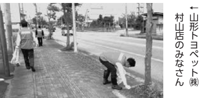
←山形トヨペット(株)村山店のみなさん

企業・団体などで実施するボランティア活動の情報を お寄せください。市報で紹介します。