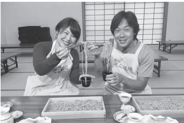
弘道お兄さんと一緒に打ったそばは、格別のおいしさでした。