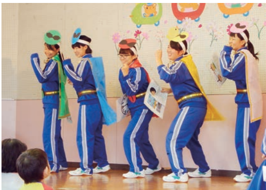
↑学んだことを市内の園児に劇で伝えた「元気アップレジャー」