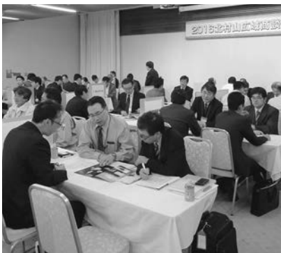
販路拡大に向け自社の技術力を発注企業にPR

2016北村山広域商談会が10月12日、クアハウス基点で開催されました。これは、市内企業の販路拡大を目的に市地域雇用創造推進協議会が主催しているもので、今年で3回目。市内外から発注企業37社、受注企業72社（うち市内企業31社）が参加しました。商談会では、事前に実施した面談希望のアンケートをもとに企業を組み合わせた面談のほか、自由に情報交換ができる時間も設定。この日だけで受発注のマッチングに成功した企業もあり、有意義な商談会となりました。