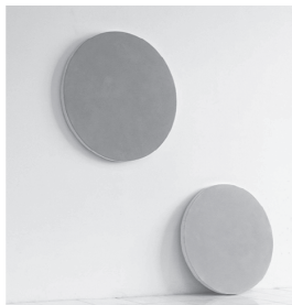
earth-blue storm (左)、earth-yellow star (右) 小林俊介作