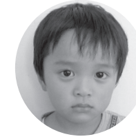
そとぼり しゅうまくん