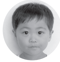
はが じゆきやくん