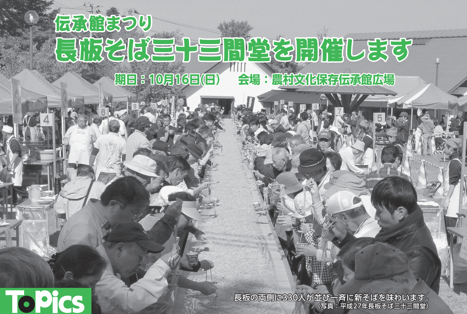
長板の両側に330人が並び一斉に新そばを味わいます。 (写真：平成27年長板そば三十三間堂)