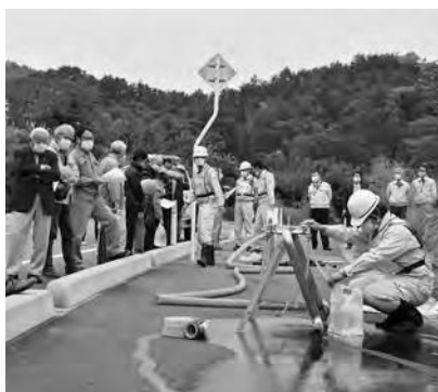
応急給水施設から給水バッグへの注水の様子

この日は楯岡地域の地区代表と民生委員代表の方々に、施設の概要説明と給水車・給水バッグへの注水などの操作実演を実施。断水時の要配慮者への配布など、給水活動に有効活用していきます。