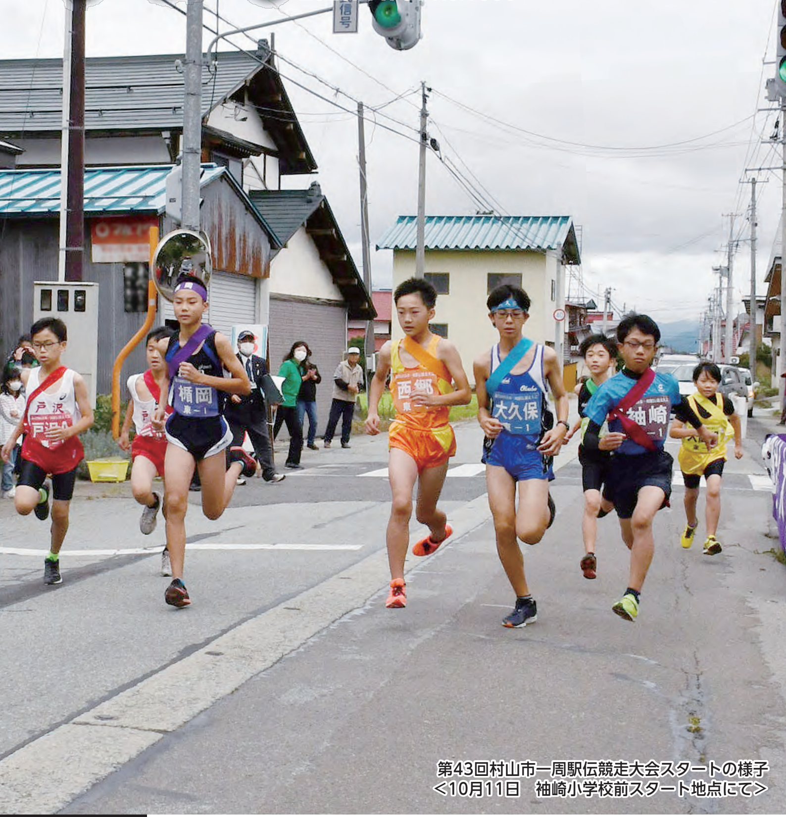
第43回村山市一周駅伝競走大会スタートの様子 ＜10月11日 袖崎小学校前スタート地点にて＞