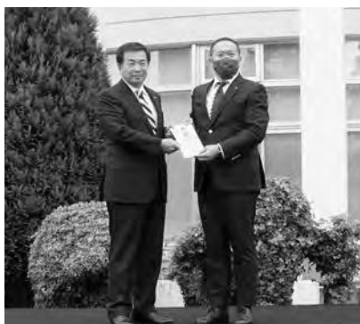
試合前に開催されたセレモニー

試合は3対0でモンテディオ山形が快勝。市民の期待に応える形となり、会場は大いに盛り上がりました。