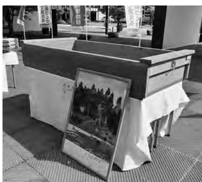
県産木材で製作されたジュンサイ摘みの箱舟

開会セレモニーでは、村山地域森林・林業功労者に表彰状が贈られたほか、県産木材で製作されたジュンサイ摘みの箱舟などが贈呈され、また、村山地域の森林や林業、森づくり活動などを紹介するパネルが展示されました。