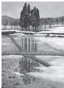
藤田八重子作「東風吹く頃」

11月20日(金)～22日(日)はむらやま教育の集いに合わせて、最上徳内記念館、最上川美術館ともに無料開放。