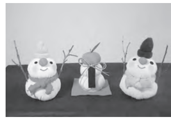
和布で作った鏡餅とスノーマン