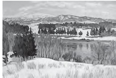
真下慶治作「冬の最上川～芦沢付近より月山～」

【最上川美術館 電話3195】 入館料 大人300円、高校生以下無料 JAFカードおよびSDカードを提示していただく割引が受けられます。 休館日 水曜日、4月8日(木) 開館時間 午前9時～午後5時