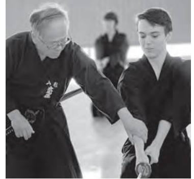
居合道体験の様子