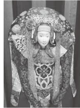
渡邊渡作「コノハナサクヤヒメ」