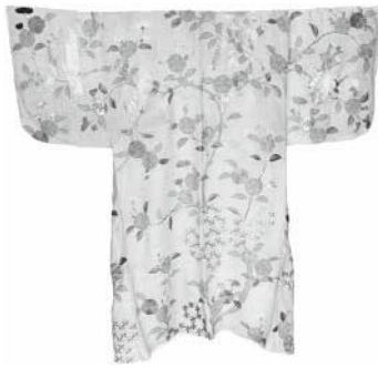
単麻地文字草花文様男子胸服