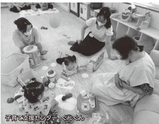
子育て支援センター ぐんぐん

子育て支援センターぐんぐんは、戸沢保育園に拠点を置き、屋内遊び場のほかに、地域に向いた親子交流イベントやサークル支援、さまざまなジャンルの育児講座を主活動としています。