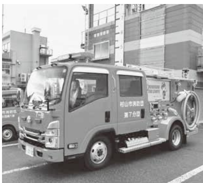
更新された新しい消防ポンプ自動車

また、第1分団第2部（楯岡地域・笛田、馬場、大沢川地区）と第3分団第1部第2班（大倉地域・金谷、南原地区）の小型動力ポンプ1台をそれぞれ更新しました。