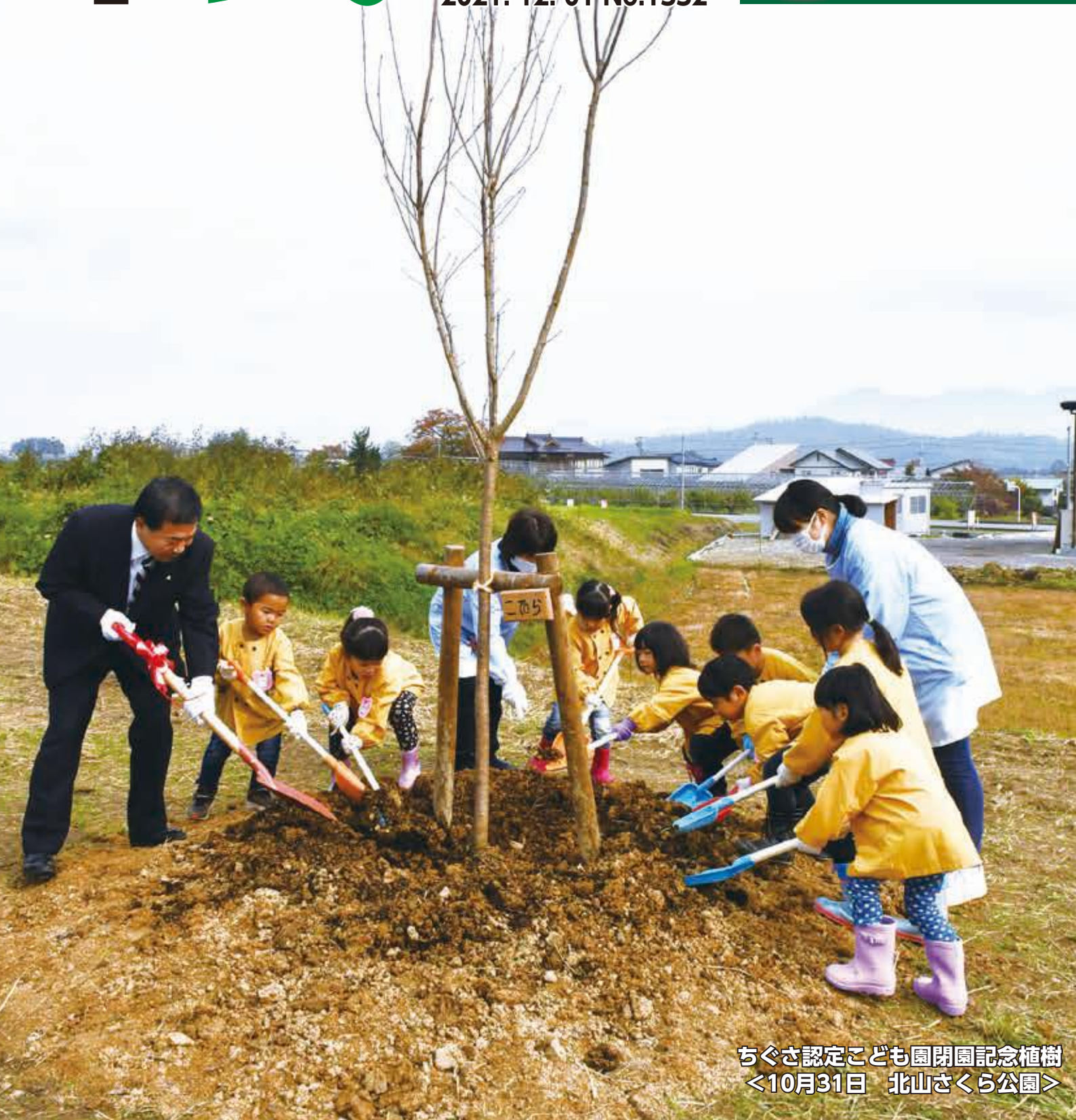
ちぐさ認定こども園閉園記念植樹 <10月31日 北山さくら公園>

村山市役所 TEL: 55-2111 (代) FAX: 55-6443 www.city.murayama.lg.jp