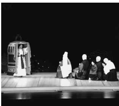
組踊の人気演目「執心鐘入」

第1部では、同じく国の重要無形文化財に指定されている琉球舞踊が披露され、第2部では、組踊の人気演目である執心鐘入が演じられました。三線や太鼓などの生演奏とともに沖縄の雰囲気包まれた客席からは、感嘆と称賛の惜しめない拍手が送られました。