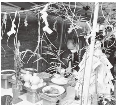
あらかきそばの「そば塚」前で行われた神事の様子

神事の終了後には、あらかきそば店内にて新そばの食味会が行われ、今年もおいしい待望の新そばに舌鼓を打っていました。