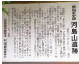
県指定史跡の看板