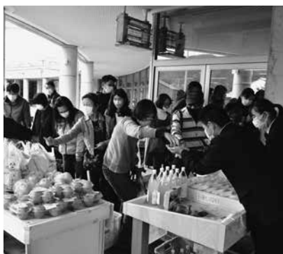
村山産業高校の生徒が生産した秋野菜や果物を販売

また、市内産のサトイモを使用した芋煮と、ラ・フランスを使用したスムージーが販売されたほか、手焼きせんべい体験会やみかんの詰め放題、プレジール・サキソフォン・アンサンブルによる演奏会などが行われ、多くの来場者でにぎわいました。