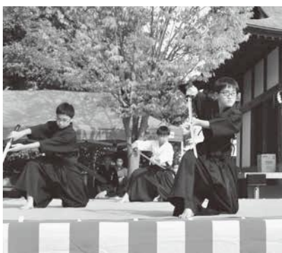
楯岡小学校居合道クラブの演武

この日は、県内外から8流派、約30人の剣士が参加。楯岡小学校居合道クラブと村山市の夢想神伝流に続き、流派ごとに奉納演武を行いました。剣士たちは静寂に包まれた会場で気迫のこもった演武を披露していました。