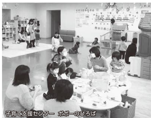
子育て支援センター ポポーのひろば

木製遊具や乳幼児向けのままごと玩具などがあり、気軽に利用することができます。親子で遊んだり、親同士が交流することもできます。