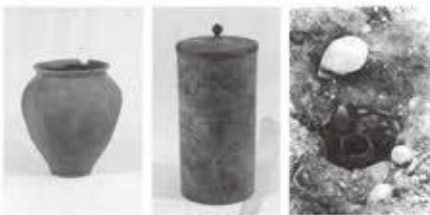
経筒外容器 経筒 出土状況

河島山経塚は、経巻を角筒製の筒に入れ、これをさらに大きな筒に巻いて、石を立て並べて作った塚の中に埋めた極めて特色のあるものである。経筒は直径 11.5 cm、高さ 21.1 cmほどの大きさで堅くない。外筒筒の筒は高さ 35.5 cm、口径 13.8 cmほどの十字絞とを斜めの印き目をもつ珠洲系のものである。経筒に納められたと思われる経巻は、現在は失われている。なお、墓の中から法華経が書かれた多字一石経も出土している。