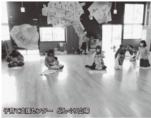
子育て支援センター どんぐり広場

小学校入学前の親子を対象に、音楽を使った親子リトミックや絵本読み聞かせなど、毎月、親子で参加できる講座を開催しています。