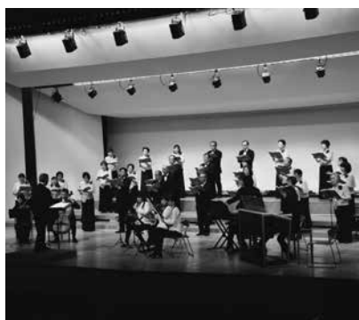
美しいハーモニーを披露するフェブリエの団員たち

第1部ではヘンデルの「メサイア」をフェブリエ室内合奏団の演奏とともに披露。第2部では混声合唱とピアノのための「中島みゆき」、第3部では混声合唱組曲「水のいのち」を歌い上げました。約40人の団員ののびやかな歌声に観客からは大きな拍手が送られました。