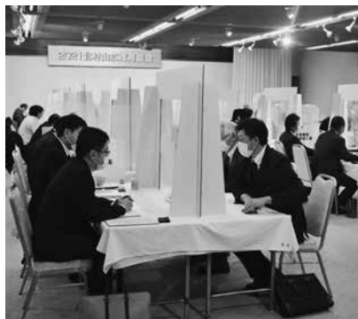
県内外から多くの企業が参加し面談

また、17日には、発注企業8社が希望する市内企業を視察するツアーも行われました。