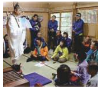
地域の寺社の宮司や住職が特別講師となることも