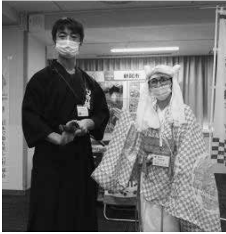
「移住・交流フェア」で山伏姿の移住「1」ディネーターと記念撮影