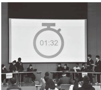
英語によるディベートの様子

その成果発表として11月14日、甄葉プラザで英語ディベート大会を開催。「制服は廃止されるべきか否か」をテーマに肯定派、否定派に分かれ、英語のみでの討論に挑戦しました。参加した中学生は、これまで培ってきた英語力を十分に発揮し、堂々と自分の意見を発表し合っていました。