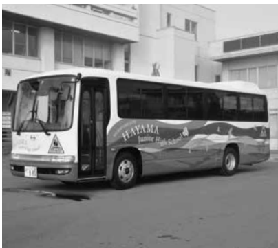
藤代氏がデザインした新スクールバス

式では関係者が安全祈願を行い、志布市長から宗片校長にキーのレプリカが手渡されました。