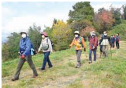
自然を愛でながらゆっくり散策

現在は「おくら伝説」「甞岳修験と古の精霊たち」「中沢の棚田」「居合の道々ルーツを訪ねて」の4コースがあり、それぞれ四季折々の景色、貴重な史跡や植物などを楽しむことができます。平成29年10月のオープンングイベント以来、これまで17回のイベントを開催し、市内外からのべ約300人にご参加いただきました。夢クラブではほかに、月1回の定例会の実施やコース整備、全国大会への参加や市内小学校からのガイド依頼への対応など、大勢の方に大倉フットパスを楽しんでもらえるよう活動しています。皆さんもぜひ、大倉フットパスコースを歩いてみてください！