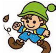
オリジナルキャラクター ケットパス君