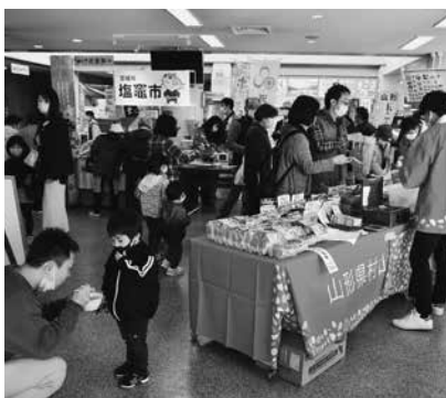
買い物客でにぎわう「厚岸・塩竈・村山んま市！」の様子

厚岸町のブースにはアサリや剥き牡蠣、シシヤモなど、塩竈市のブースにはブランドマグロ「三陸塩竈ひがしもの」やかまぼこ、魚の干物などが並び、村山市からはラ・フランスやリンゴ、薔薇 ばら ジェラートなどを出品。多くの買い物客が訪れ、新鮮な海の幸や山の幸を買い求めにぎわいました。