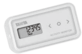
タニタの活動量計